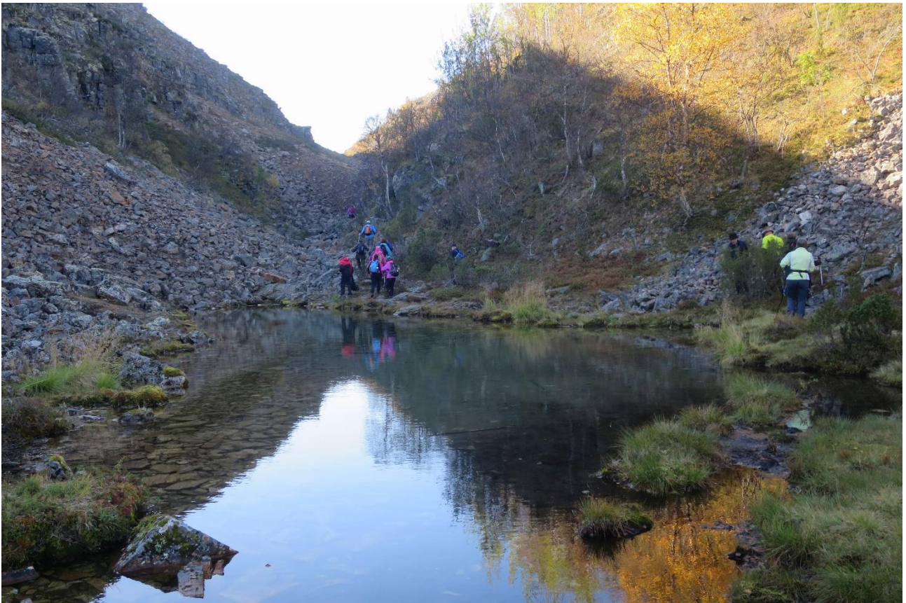
Upeat maisemat matkan varrella