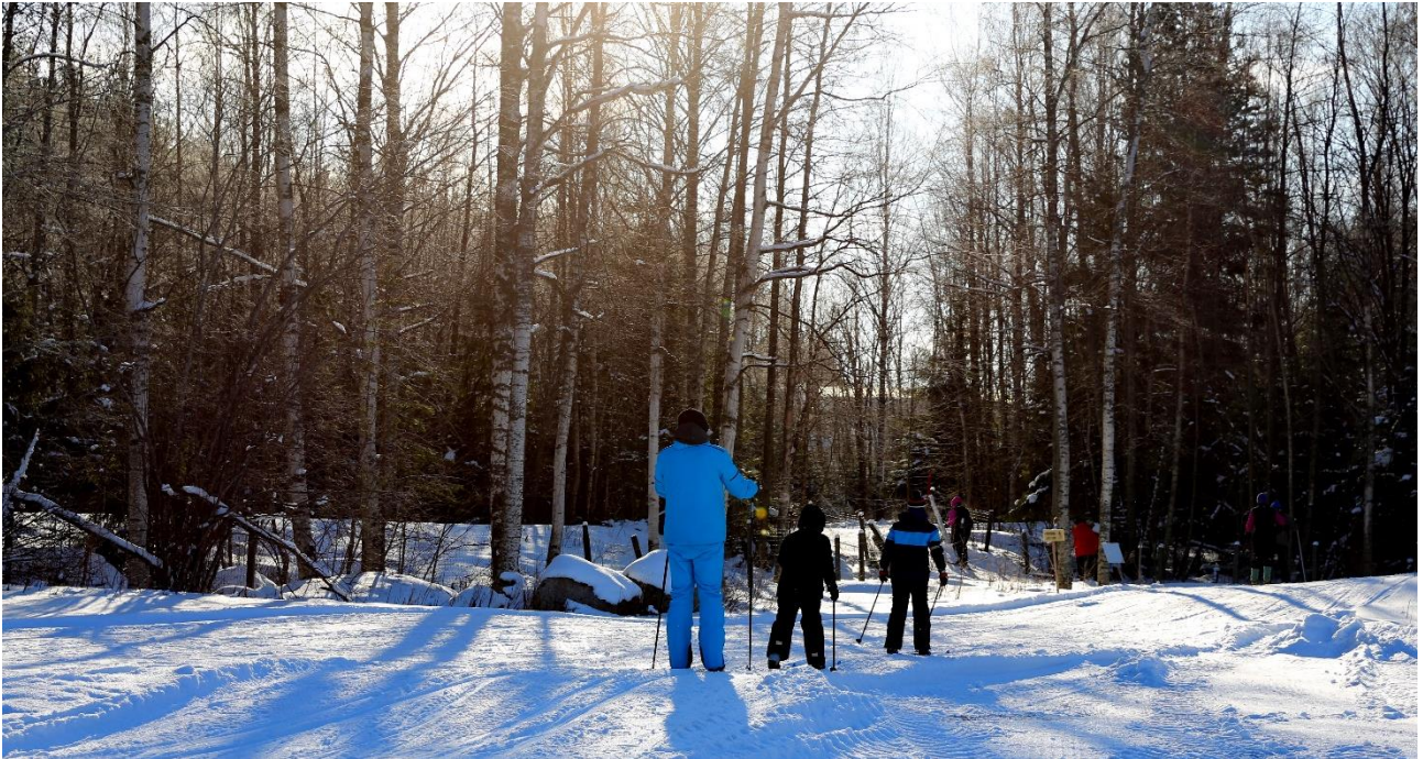
Suunta kohti erämaahiihtoa

Helmikuun viimeisenä viikonloppuna (23.-25.2.) ulkoili Repoveden kansallispuiston ja Orilammen Majan maastossa runsas joukko ihmisiä Repoveden ulkoilu- ja elämispäivien merkeissä. Tarjolla oli runsaasti erilaisia mahdollisuuksia ulkoilla ja liikkua vaikkapa koko perheen voimin. Perjantaina ohjelma oli suunniteltu lähinnä yritysten tyhy-toimintaa ajatellen, kun taas viikonloppun ohjelmassa oli huomioitu perheet. Valkealan Latu ry pääjärjestäjänä vastasi suurelta osalta talkootöistä ja talkoolaisia tapahtumassa oli useita kymmeniä. Valkealan Ladun apuna tapahtuman toteutuksessa oli runsas joukko muita yhdistyksiä ja yrityksiä/ yrittäjiä sekä Kouvolan kaupunki.