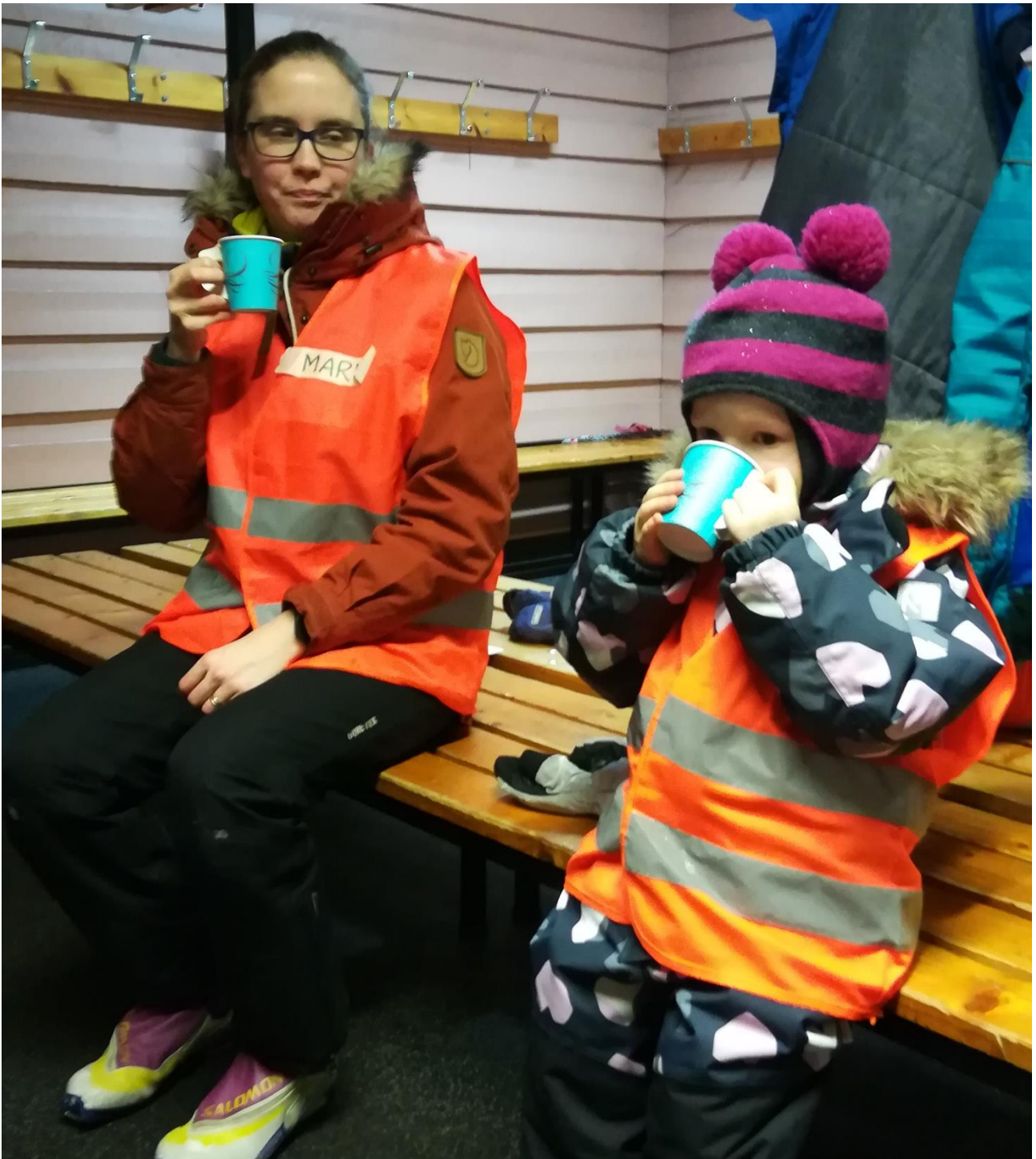
Lämmin mehu maistuu hiihtojen jälkeen

Helmikuulle aiemmin ajoittunut Lappalan lenkki jouduttiin perumaan jo toisena vuotena peräkkäin huonon lumitilanteen ja latupohjien kunnan vuoksi.