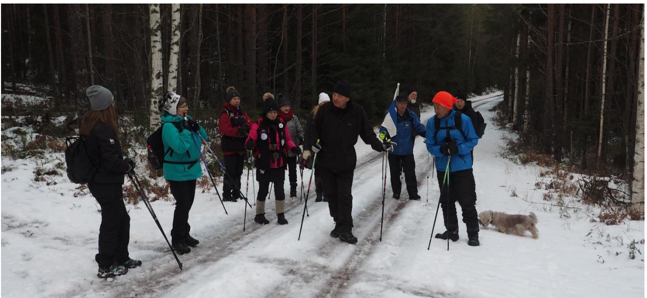
Taukohetki (kuva: Valkealan Sanomat/ Janne Kousa)