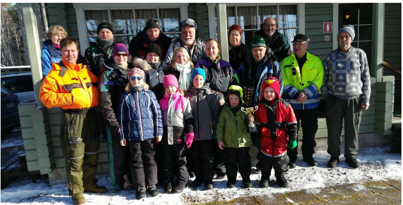
Valkealan Latu ry:n joukkuetta