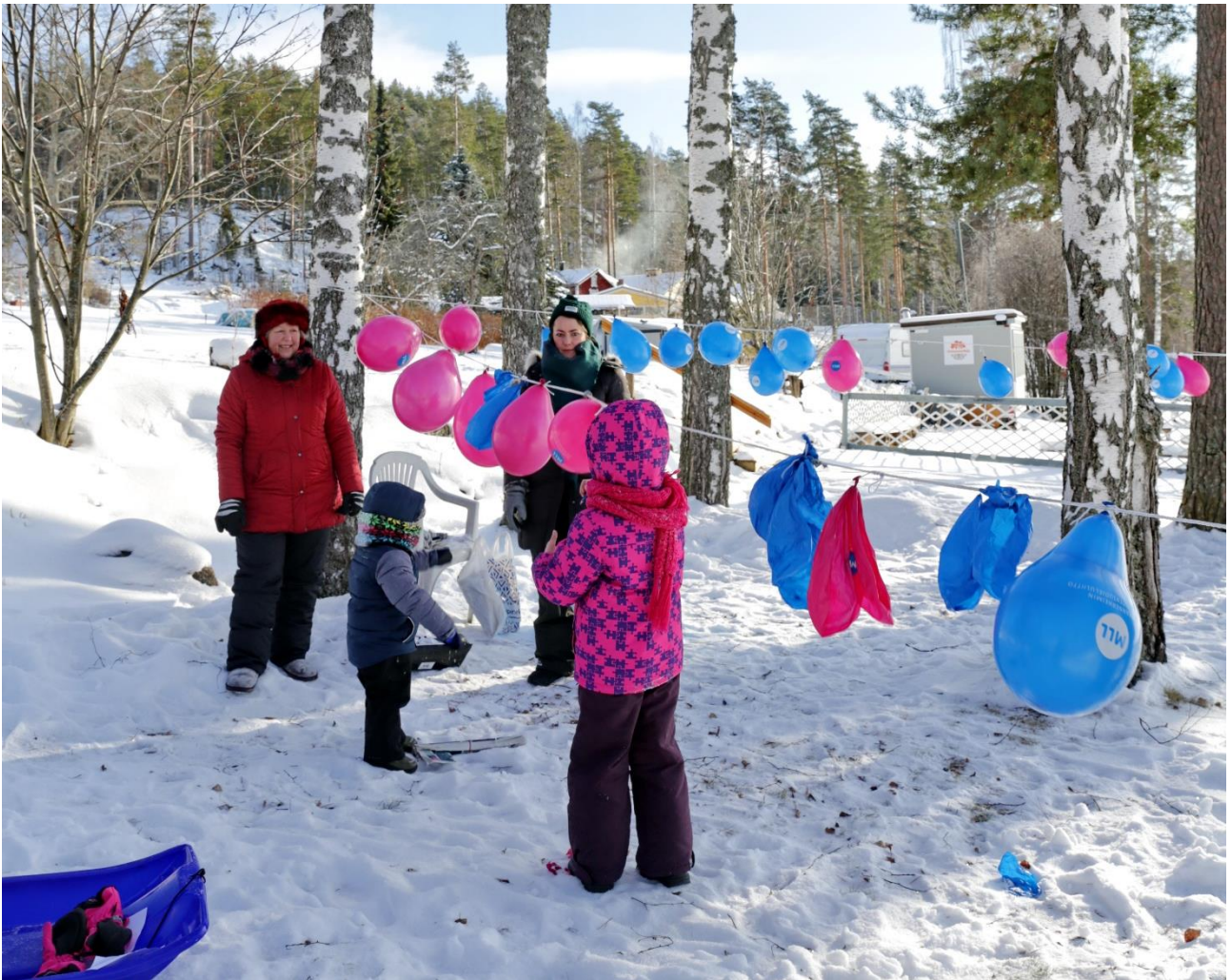
Ulkona voi tehdä monenlaista kivaa