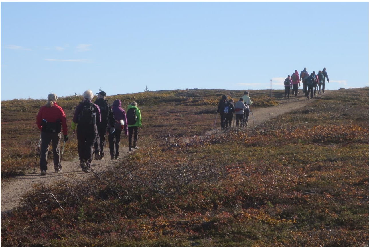
Patikointia