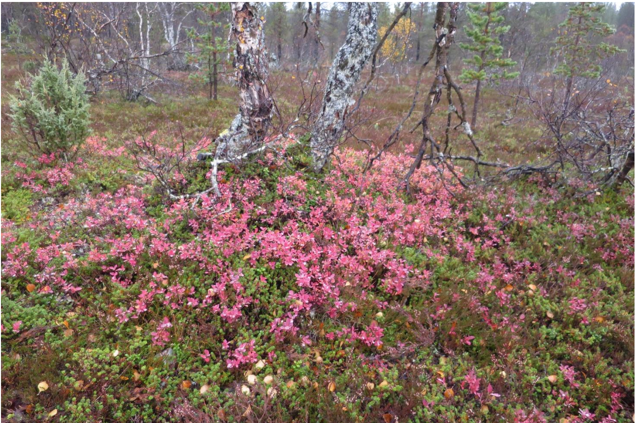
Luonnon värejä