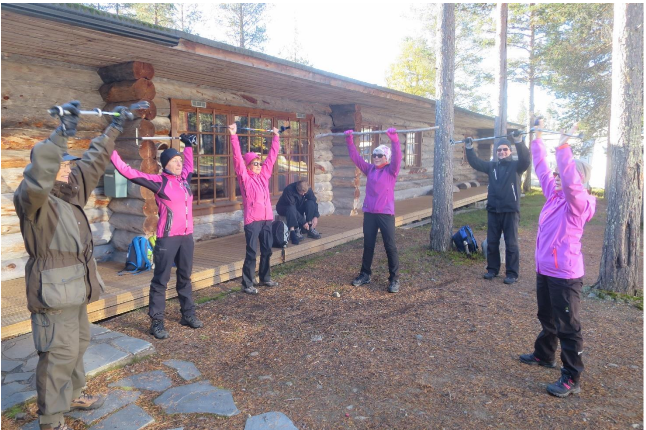
Venytellen vetreäksi