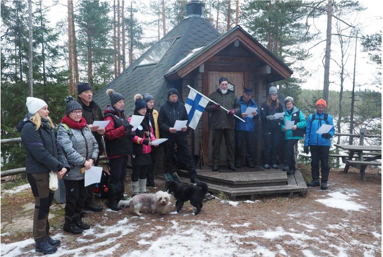
Määkijän kodalla